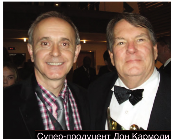
Супер-продуцент Дон Кармоди